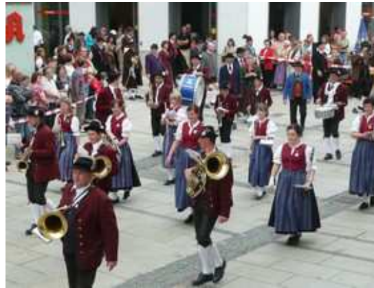
Vue du défilé depuis la nouvelle tribune

Comme chaque année le séjour des Cagnois à Passau pour les fêtes de la Maidult s'est déroulé dans une ambiance très chaleureuse.