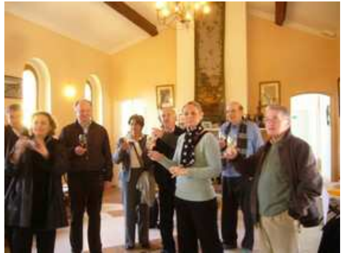
Séance de dégustation

remontent au 3 ème siècle avant J.C. Les Grecs, fondateurs récents de Nice (Nikaïa) ont importé des cépages, puis les Romains ont perpétué la culture de la vigne, qui a trouvé là des conditions très favorables.