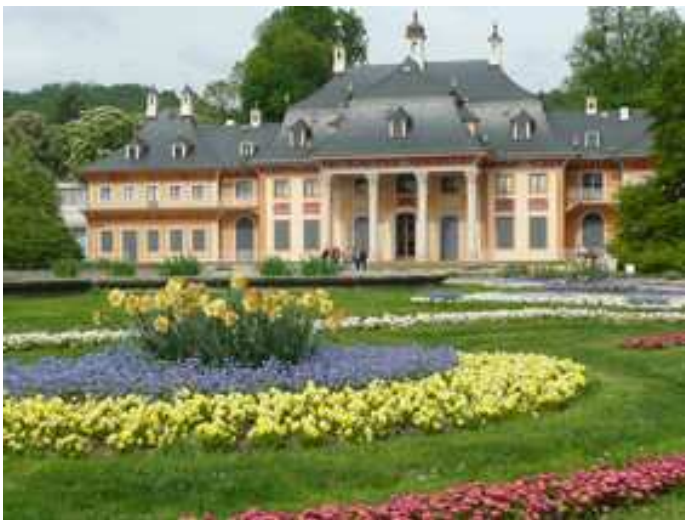
Château de PILLNITZ

coupoles. Elle a été le sujet d'un tableau remarquable du peintre italien Canaletto.