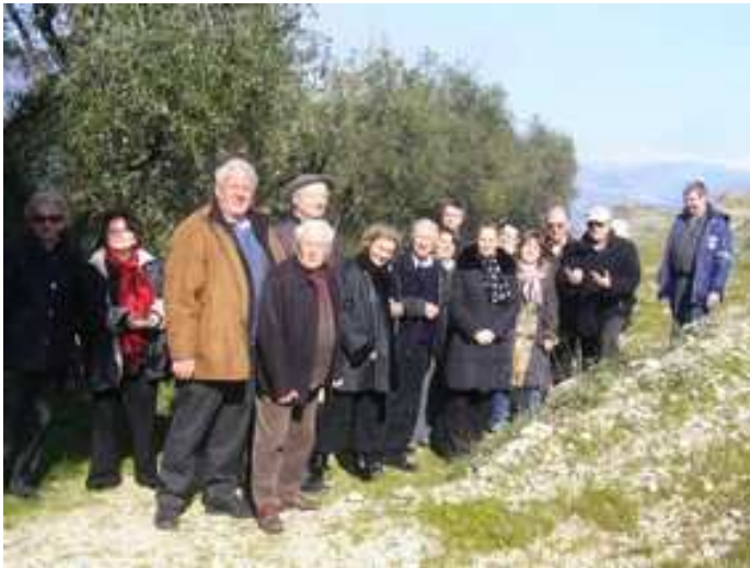
Visite du vignoble

La récolte se fait uniquement à la main. La production fournit 42 % de vins rouges, 37 % de blancs et 21 % de rosés. Elle est vendue essentiellement à des restaurants qui réservent souvent d'avance leurs