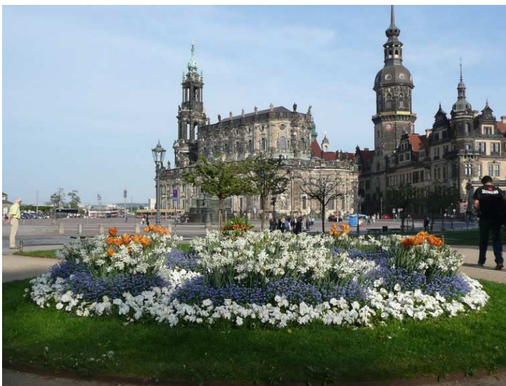
la Hofkirche (Eglise de la Cour) et le Château

Après notre séjour à Passau au moment de la Maidult, notre grande