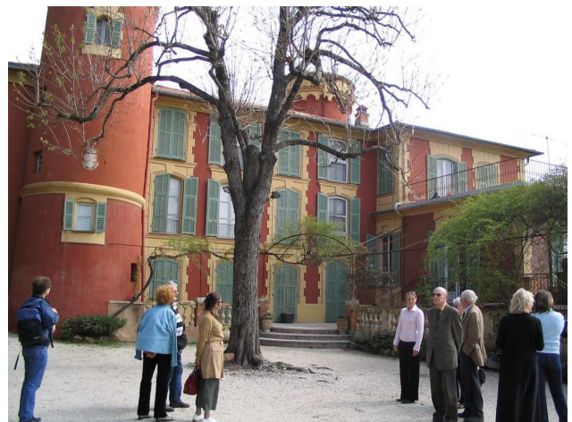
Château de Bellet

La Commission de Bruxelles avait annoncé le 27 avril 2009 qu'elle autoriserait le « coupage des vins rosés », c'est-à-dire en fait couper les vins blancs en excédent par 4 à 5% de vins rouges afin d'obtenir des rosés ! Devant l'absurdité d'une telle proposition, les professionnels de la branche sont montés au créneau. Le rosé est un vin à part entière, il est issu de raisins noirs dont la pulpe blanche ne reste que peu de temps en contact avec les peaux. Et... la Commission vient de renoncer à ce projet ! Voilà un épilogue heureux qui clot le chapitre.